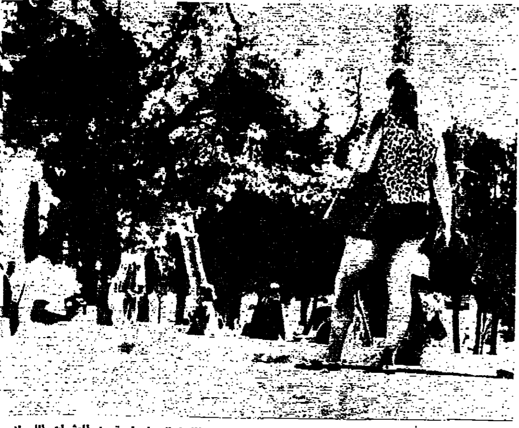
يحل هذا اللباس الفاضح تنسب الاسرائيليات الان الحرم القديسي الشريف انها واحدة من العشرات للسلواني يتجولون كل يوم في ساحاته بهذا الشكل (صورة خاصة بالستور)

القاهرة - رويتر - اعلن ان الامانة العامة لجامعة الدول العربية وجهت دعوات الى وزراء خارجية الدول الاعضاء لحضور دورة مجلس الجامعة في الثالث من ايلول القادم. الموقف الاميركي من أزمة الشرق الاوسط باريس - وصل وكيل وزارة الخارجية الاميركية نيكولاس كاتزبراج الى جنيف امس قادما من نيويورك حيث اجري محادثات رسمية استغرقت ثلاثة ايام. وصرح قبل سفره من نيويورك للصحفيين بان الولايات المتحدة تشعر بنزول السلم في الشرق الاوسط ليس مرغوبا فيه. فحسب بل ضروري لجميع الدول الحظوة واصفياقول ان الولايات المتحدة تريد بقوة مهمة الدكتور غونار يارنغ المبعوث الدولي للشرق الاوسط وقرار تجديد الامن وتقال انه يتوجب على دول الحظوة ان تتفق فيما بينها على سلام راسخ ودائم وانه من الاهمية بمكان كبر سلام تلك الحظوة بل وربما لسلام العالم ان يتحقق هذا الامر ضروريا.